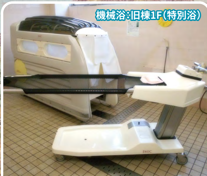
機械浴:旧棟1F(特別浴)

座位姿勢保持が困難な方や寝たきりの方など入浴が困難な方でも安心して入浴ができる浴室です。機械浴槽はプライバシーの保護に配慮したドーム形状になっています。浴槽内は上下からシャワーが出ることでマッサージのような効果が得られて高い保温性があります。また、シャワー温度を常に監視して自動制御で危険を回避することが出来ます。入浴方法は専用のストレッチャーに乗車して寝たまゝの状態髪や体を洗うことが出来ます。そして、そのまま浴槽内に入ることが出来る様式になっています。