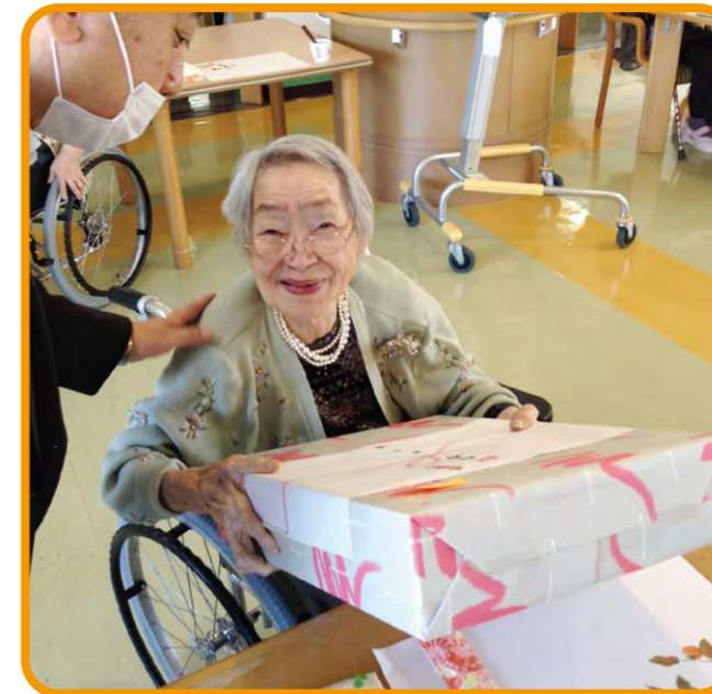
敬老祝賀会の様子

(例年であればご家族様をお招きし、行っていたものを施設内でゲストの方々のみで開催に変更)