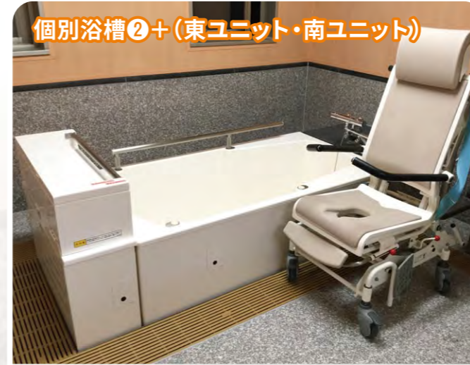
個別浴槽②+(東ユニット・南ユニット)

サテライト百楽園ではゲスト様の身体状況や環境に合わせ、快適に入浴して頂けるよう3つの浴槽をご用意しています。入浴されるゲスト様に対し職員が1人付き、出来る限りゲスト様の入浴したい日や時間に応え、満足して頂けるよう対応しています。