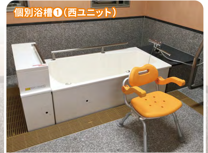
個別浴槽①(西ユニット)

個別浴槽②は、右側の個別浴槽①より大きい浴槽になっており、身体が大きい方がゆったりと湯船に浸かれるようになっています。またシャワーチェアの角度を変えることが出来、座位姿勢が困難な方の負担を軽減することが可能です。個料同様手すりの位置を変えることが可能であり、自力で湯船に入ることもできます。