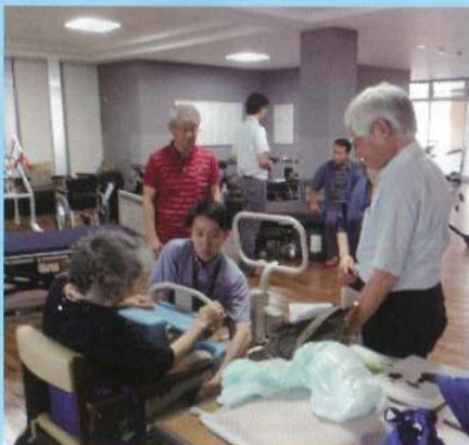
立ち上がり補助機器 スタンディングリフト