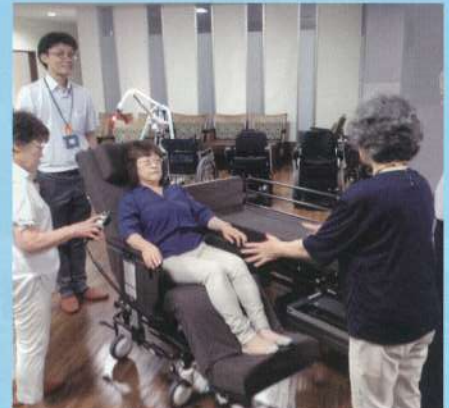
車椅子になる電動ベッド