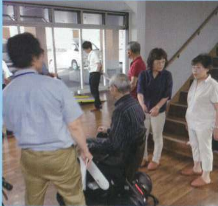
小回りの利く電動車椅子

今年度もサテライト百楽園1階にて、介護ロボットが見学・体験できる「北海道介護ロボット普及推進センター(道南地区)」が設置されました。昨年には無かったスタンディングリフトやお掃除ロボット、足こぎ車椅子等約30機種を常設しています。施設や在宅で介護者、利用者の負担軽減に繋がるロボットが多数ありますので是非見学、体験にいらしてください。なお来年の3月まで実施しております。※見学希望は「株式会社マルベリーさわやかセンター函館」のホームページから予約が必要です。問い合わせは「さわやかセンター函館」TEL0138-34-3084へ。