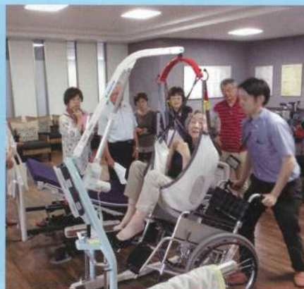
持ち上げないで移乗できる 床走行リフト