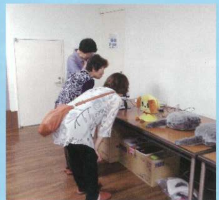
コミュニケーションロボット