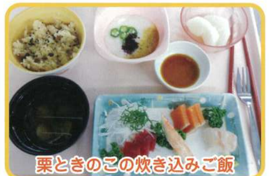
栗ときのこの炊き込みご飯